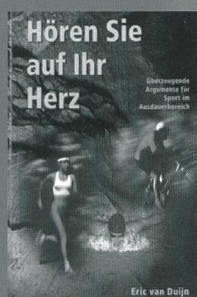
Hören Sie auf Ihr Herz Fr. 19.80/17.80