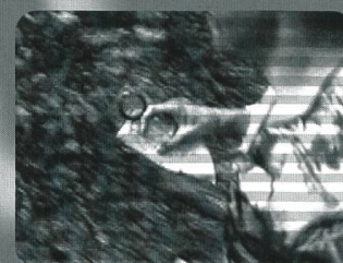
Mental unterstütztes Techniktraining im Orientierungslauf (1998) Fr. 35.60