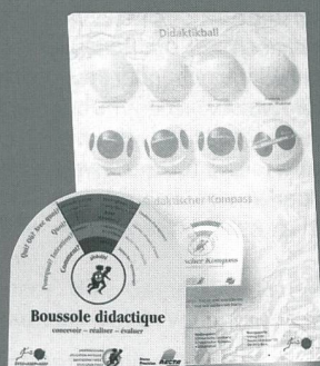
Didaktik-Set (Ball, Landkarte, Kompass) Fr. 10.-