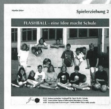
Flashball - Spiel- erziehung 2 (1998) Fr. 12.-