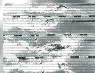
Video: Crawl (1989) Fr. 45.30