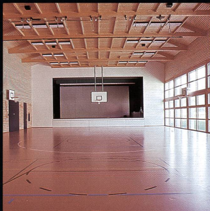
Mehrzweckhalle mit Bühne Progyzentrum Rebstein