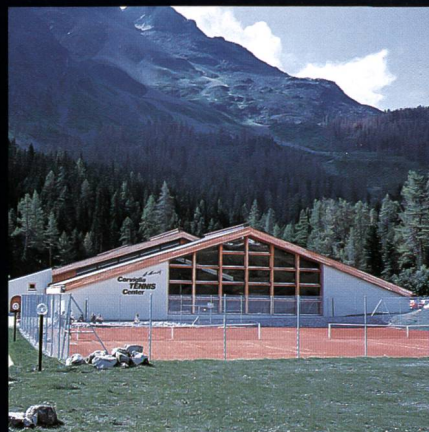
Corviglia-Tennis- und Squashhalle Kur- und Verkehrsverein St. Moritz