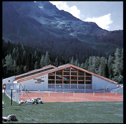
Corviglia-Tennis- und Squashhalle Kur- und Verkehrsverein St. Moritz