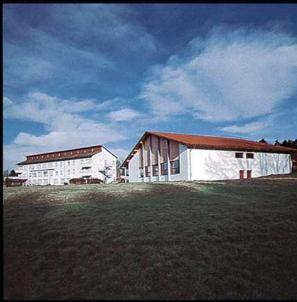
Bildungs- und Sportzentrum SVKT Chlotisberg Gelfingen