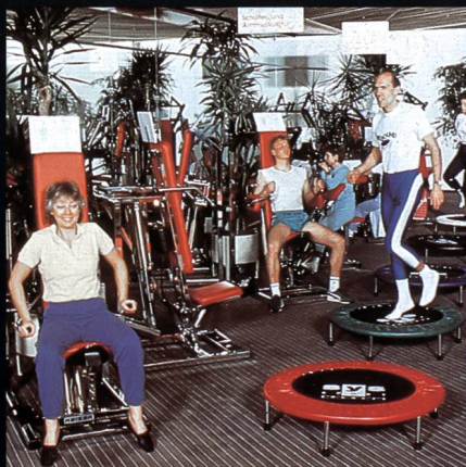
Freizeit- + Sportzentrum MIGROS Greifensee