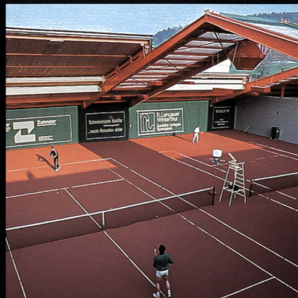
AGOB-Schiebedachhallen Tenniscenter Grütze Winterthur