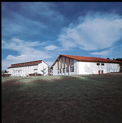
Bildungs- und Sportzentrum SVKT Chlotisberg Gelfingen