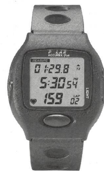
POLAR Accurex Plus™

Mit dem Accurex.Plus™ sind auch Sie dem Erfolg auf der Spur, ob in der Gruppe oder solo wie die siegreiche Franziska Rochat-Moser. Dank drahtloser, digital codierter Übertragung von Herzfrequenz, Anzeige von Echtzeit, Stoppuhr und Countdown-Timer wissen Sie stets, woran Sie sind – auch beim Auswerten der gespeicherten Daten am PC. Im Fachhandel erhältlich.