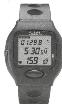
POLAR Accurex Plus™

Mit dem Accurex.Plus™ sind auch Sie dem Erfolg auf der Spur, ob in der Gruppe oder solo wie die siegreiche Franziska Rochat-Moser. Dank drahtloser, digital codierter Übertragung von Herzfrequenz, Anzeige von Echtzeit, Stoppuhr und Countdown-Timer wissen Sie stets, woran Sie sind – auch beim Auswerten der gespeicherten Daten am PC. Im Fachhandel erhältlich.