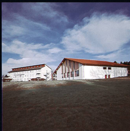
Bildungs- und Sportzentrum SVKT Chlotisberg Gelfingen