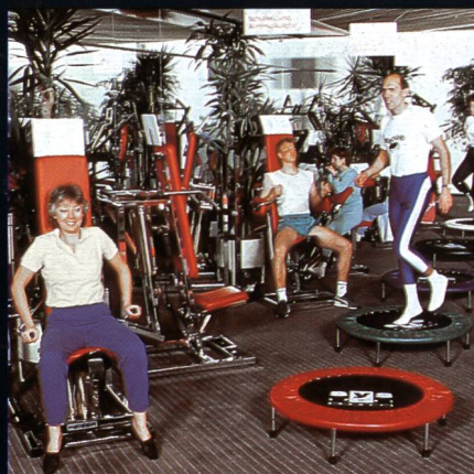
Freizeit- + Sportzentrum MIGROS Greifensee