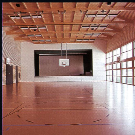
Mehrzweckhalle mit Bühne Progyzentrum Rebstein