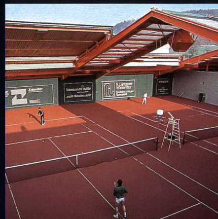
AGOB-Schiebedachhallen Tenniscenter Grüze Winterthur