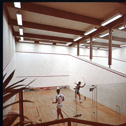
Swissair-Freizeitanlage Bassersdorf mit Squashcenter und Tennishalle