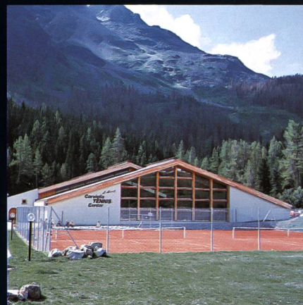
Corviglia-Tennis- und Squashhalle Kur- und Verkehrsverein St. Moritz