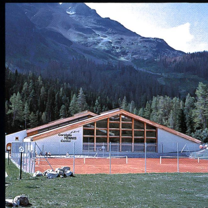
Corviglia-Tennis- und Squashhalle Kur- und Verkehrsverein St. Moritz