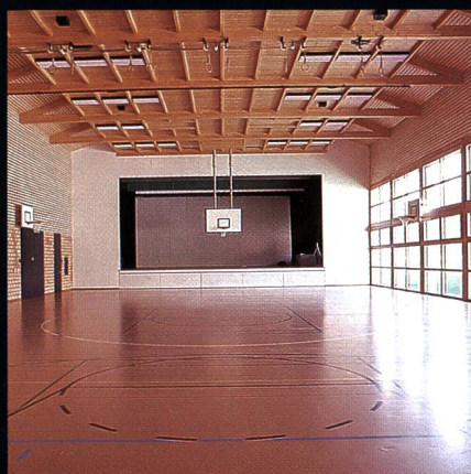
Mehrzweckhalle mit Bühne Progyzentrum Rebstein