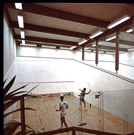
Swissair-Freizeitanlage Bassersdorf mit Squashcenter und Tennishalle

Fordern Sie noch heute unver- bindlich unsere Unterlagen an!