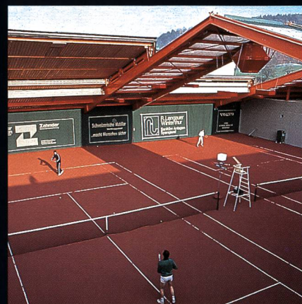
AGOB-Schiebedachhallen Tenniscenter Grütze Winterthur