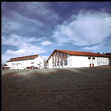
Bildungs- und Sportzentrum SVKT Chlotisberg Gelfingen