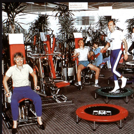
Freizeit- + Sportzentrum MIGROS Greifensee