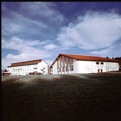
Bildungs- und Sportzentrum SVKT Chlotisberg Gelfingen