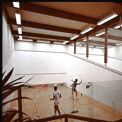
Swissair-Freizeitanlage Bassersdorf mit Squashcenter und Tennishalle