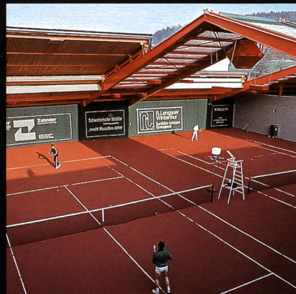
AGOB-Schiebedachhallen Tenniscenter Grütze Winterthur