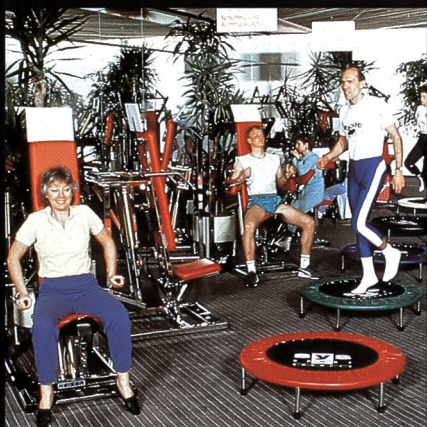
Freizeit- + Sportzentrum MIGROS Greifensee