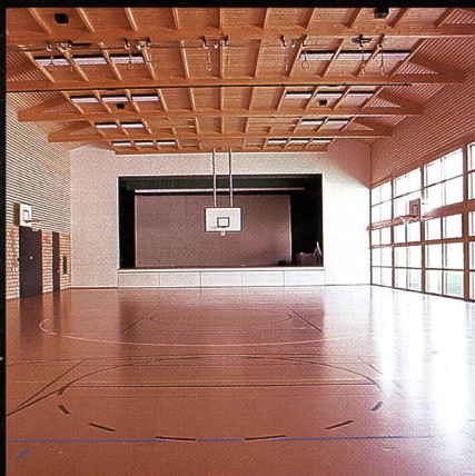
Mehrzweckhalle mit Bühne Progyzentrum Rebstein