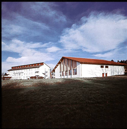
Bildungs- und Sportzentrum SVKT Chlotisberg Gelfingen