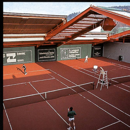
AGOB-Schiebedachhallen Tenniscenter Grüze Winterthur