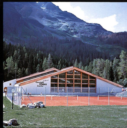
Corviglia-Tennis- und Squashhalle Kur- und Verkehrsverein St. Moritz

Fordern Sie noch heute unver- bindlich unsere Unterlagen an!