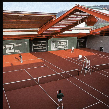
AGOB-Schiebedachhallen Tenniscenter Grütze Winterthur