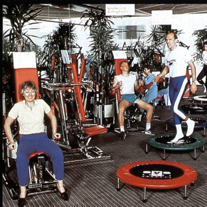
Freizeit- + Sportzentrum MIGROS Greifensee