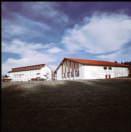
Bildungs- und Sportzentrum SVKT Chlotisberg Gelfingen