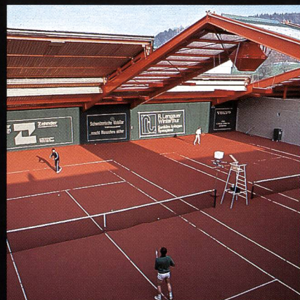
AGOB-Schiebedachhallen Tenniscenter Grütze Winterthur