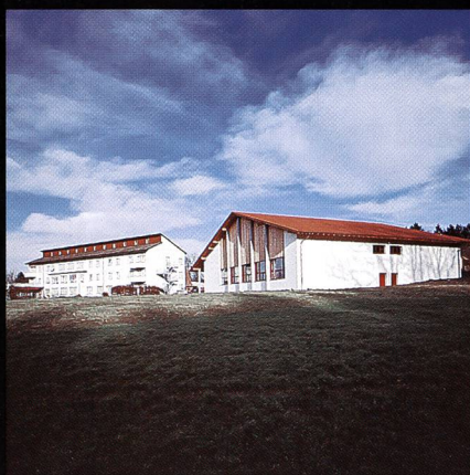
Bildungs- und Sportzentrum SVKT Chlotisberg Gelfingen