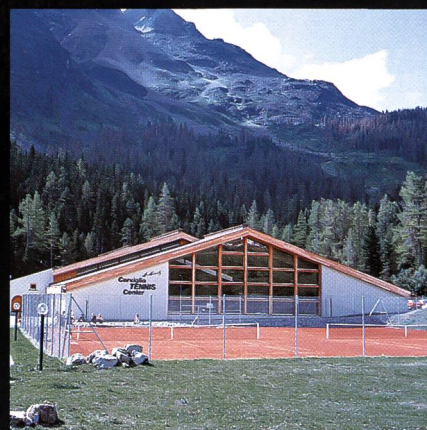
Corviglia-Tennis- und Squashhalle Kur- und Verkehrsverein St. Moritz