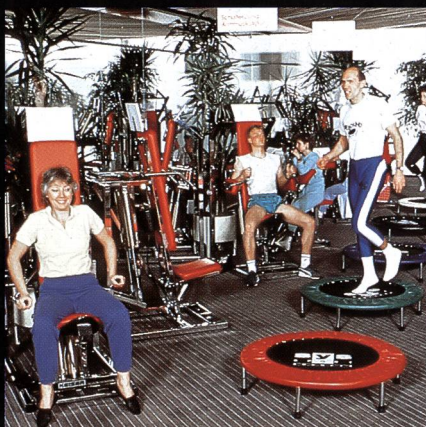
Freizeit- + Sportzentrum MIGROS Greifensee