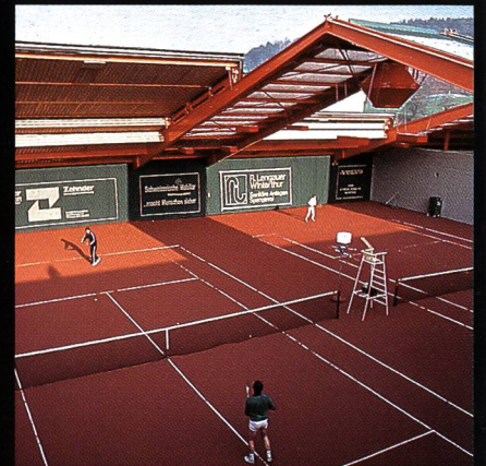
AGOB-Schiebedachhallen Tenniscenter Grütze Winterthur