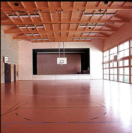
Mehrzweckhalle mit Bühne Progyzentrum Rebstein