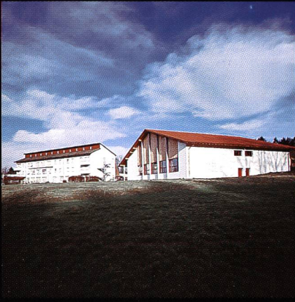
Bildungs- und Sportzentrum SVKT Chlotisberg Gelfingen