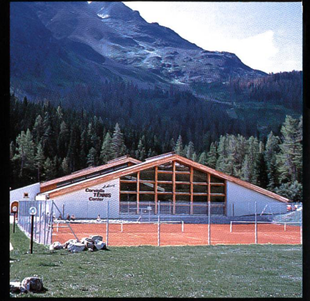
Corviglia-Tennis- und Squashhalle Kur- und Verkehrsverein St. Moritz