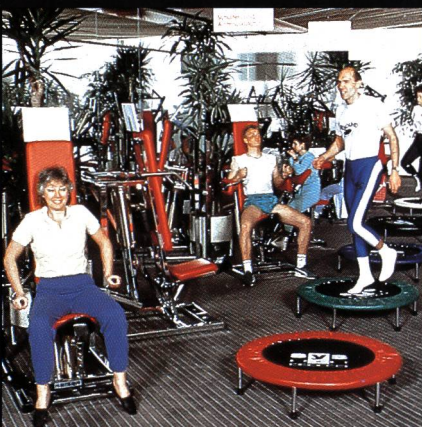
Freizeit- + Sportzentrum MIGROS Greifensee