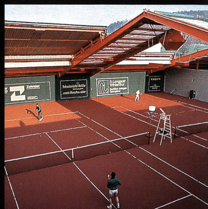
AGOB-Schiebedachhallen Tenniscenter Grüze Winterthur