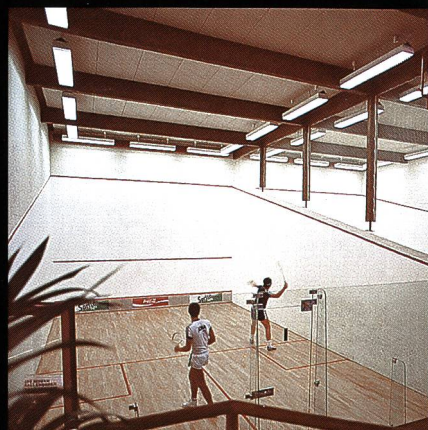
Swissair-Freizeitanlage Bassersdorf mit Squashcenter und Tennishalle