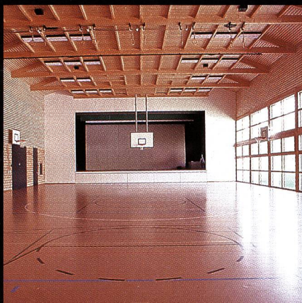
Mehrzweckhalle mit Bühne Progyzentrum Rebstein