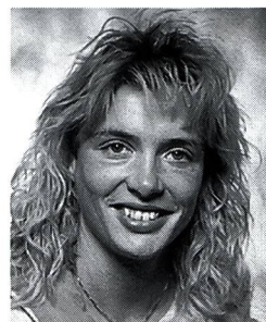
Regula Zürcher-Scalabrini Schweizermeisterin, mehrfache Olympia- und Weltmeisterschaftsteilnehmerin 400/800m

Das Tragen von SCHRITT in der Freizeit bringt mir ein zusätzliches Training ohne Zeitaufwand. SCHRITT zwingt mich in eine aufrechte Haltung, was meinen Laufstil verbessert. Meine Bein-, Gesäß-, Bauch- und Rückenmuskulatur wird vorbeugend ständig gestärkt. Das ist Grundvoraussetzung für häufiges Krafttraining ohne folgende Rückenleiden.