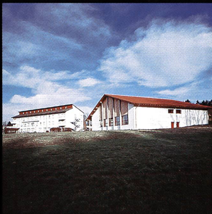
Bildungs- und Sportzentrum SVKT Chlotisberg Gelfingen