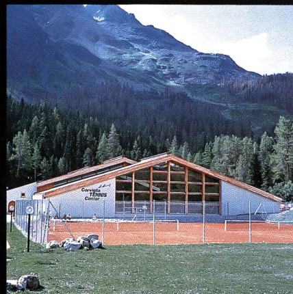
Corviglia-Tennis- und Squashhalle Kur- und Verkehrsverein St. Moritz