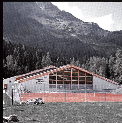
Corviglia-Tennis- und Squashhalle Kur- und Verkehrsverein St. Moritz