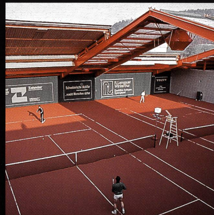
AGOB-Schiebedachhallen Tenniscenter Grütze Winterthur