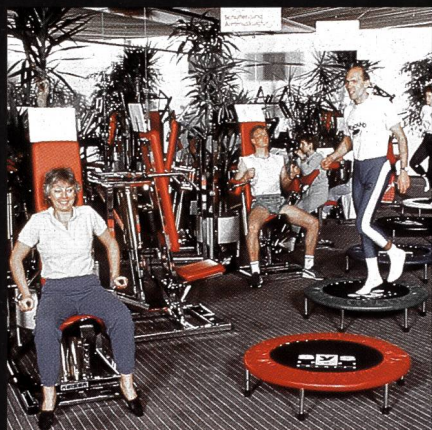
Freizeit- + Sportzentrum MIGROS Greifensee