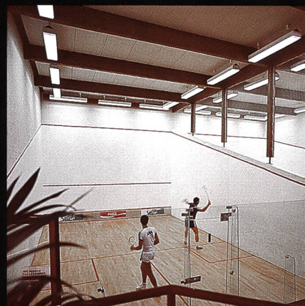
Swissair-Freizeitanlage Bassersdorf mit Squashcenter und Tennishalle

Fordern Sie noch heute unver- bindlich unsere Unterlagen an!