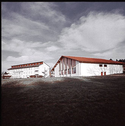
Bildungs- und Sportzentrum SVKT Chlotisberg Gelfingen