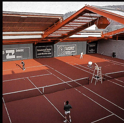
AGOB-Schiebedachhallen Tenniscenter Grütze Winterthur