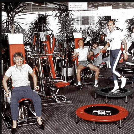
Freizeit- + Sportzentrum MIGROS Greifensee