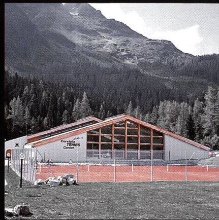
Corviglia-Tennis- und Squashhalle Kur- und Verkehrsverein St. Moritz