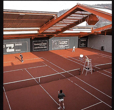
AGOB-Schiebedachhallen Tenniscenter Grütze Winterthur