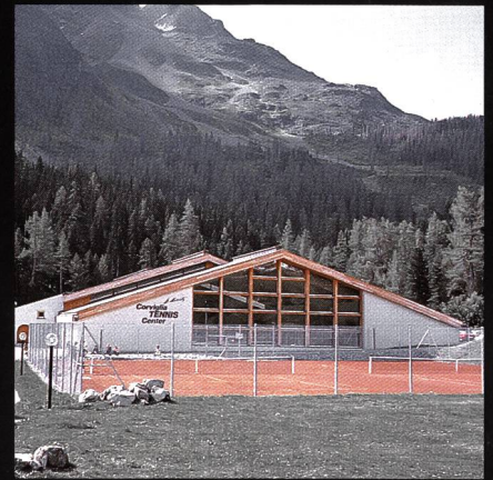
Corviglia-Tennis- und Squashhalle Kur- und Verkehrsverein St. Moritz