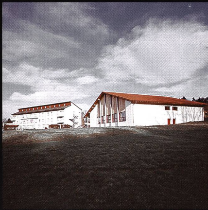
Bildungs- und Sportzentrum SVKT Chlotisberg Gelfingen