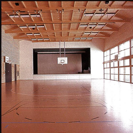
Mehrzweckhalle mit Bühne Progyzentrum Rebstein