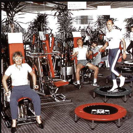
Freizeit- + Sportzentrum MIGROS Greifensee