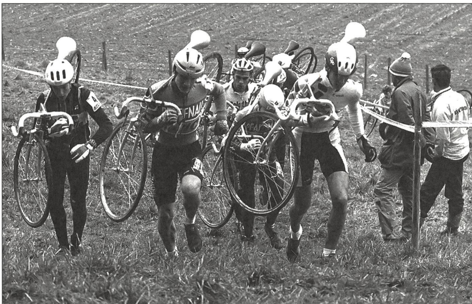
CoQ 10 führte bei einer Gruppe Radfahrern zu keiner Leistungsverbesserung.

Da diese Faktoren für Gesundheit und Ausdauerleistungsvermögen von Athleten eine grosse Rolle spielen, wurde schon früh angenommen, dass CoQ 10 eine wirksame Nahrungsergänzung für