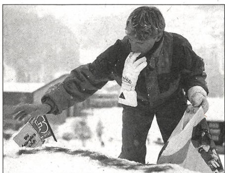
Lärchennadeln als Orientierungshilfe, um bei schlechter Sicht den Schanzentisch nicht zu verfehlen.

Mit dem Skiakrobatikleiterkurs verfolgen wir drei Zielsetzungen. Wir möchten interessierte Skileiterinnen und Skileiter, Skilehrerinnen und Skilehrer in die drei Disziplinen Ballett, Springen und Buckelpistenfahren einführen. Gleichzeitig hinterfragen wir unseren Unterricht nach methodischen Gesichtspunkten. So werden die Absolventen in der persönlichen Skitechnik gefördert und können nebenbei ihren didaktischen «Unterrichts-Horizont» auffrischen und mit Themen aus der Skiakrobatik bereichern. Da sich für diesen Kurs meistens Unterrichtende interessieren (Skilehrerinnen und Skilehrer mit J+S-Anerkennung erhalten nach dem Kurs das Brevet des Schweizer Skiakrobatiklehrerverbandes), ist für einen regen Erfahrungsaustausch während des Kurses ebenfalls gesorgt.