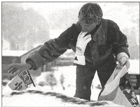
Lärchennadeln als Orientierungshilfe, um bei schlechter Sicht den Schanzentisch nicht zu verfehlen.

Mit dem Skiakrobatikleiterkurs verfolgen wir drei Zielsetzungen. Wir möchten interessierte Skileiterinnen und Skileiter, Skilehrerinnen und Skilehrer in die drei Disziplinen Ballett, Springen und Buckelpistenfahren einführen. Gleichzeitig hinterfragen wir unseren Unterricht nach methodischen Gesichtspunkten. So werden die Absolventen in der persönlichen Skitechnik gefördert und können nebenbei ihren didaktischen «Unterrichts-Horizont» auffrischen und mit Themen aus der Skiakrobatik bereichern. Da sich für diesen Kurs meistens Unterrichtende interessieren (Skilehrerinnen und Skilehrer mit J+S-Anerkennung erhalten nach dem Kurs das Brevet des Schweizer Skiakrobatiklehrerverbandes), ist für einen regen Erfahrungsaustausch während des Kurses ebenfalls gesorgt.