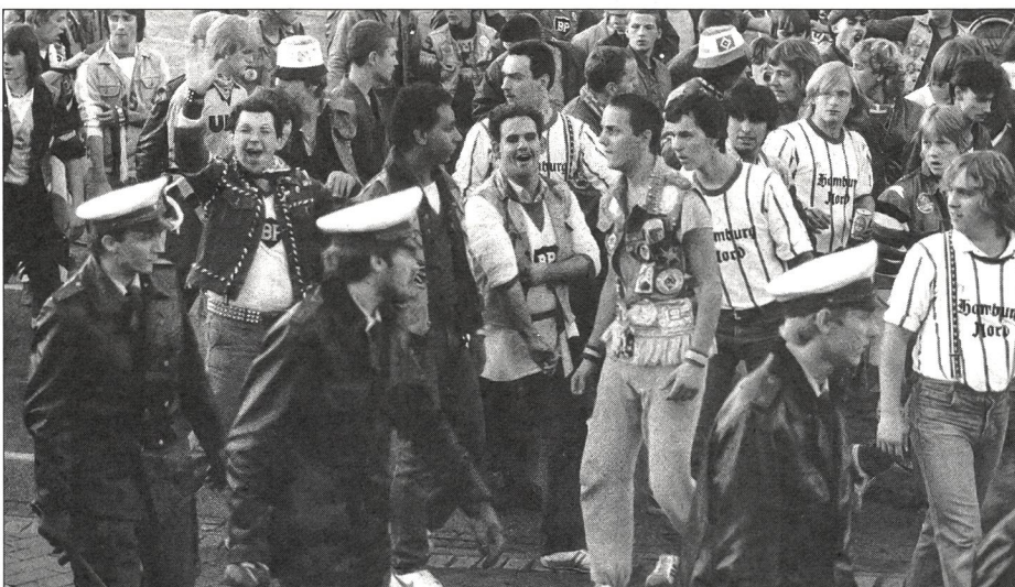
Eine Konfrontation mit der Polizei wird oft bewusst gesucht.