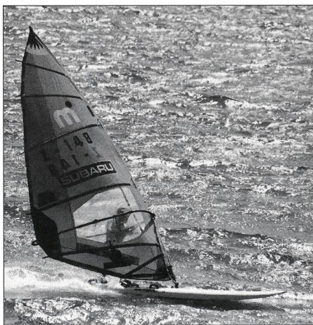
Zum Titelbild: Windsurfen – eine noch junge Sportart und eine dynamische Sportart auch was Führung, Ausbildung und Entwicklung anbetrifft. Die AV-Fachstelle der ESSM hat vor kurzem einen beachtenswerten Film fertig gestellt, den der J+S- Fachleiter in seinem Artikel auf den Seiten 2 und 3 beschreibt.

MAGGLINGEN / MACOLIN erscheint monatlich in drei Sprachen deutsch / französisch / italienisch