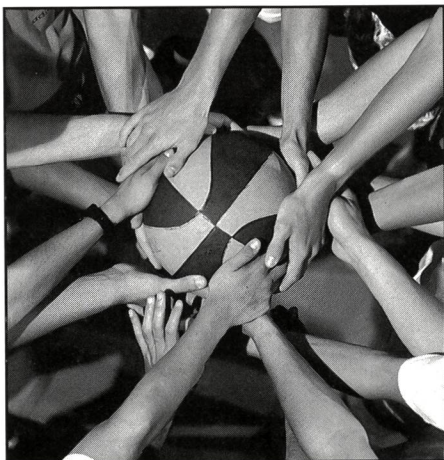
Zum Titelbild: Die Hände am Ball! Das geschickte Umgehen mit dem Ball ist erste Voraussetzung für einen guten Spieler in einer Ballsportart. Ein Team aber kann nur bestehen, wenn aus Einzelspielern eine Gemeinschaft geformt wird. Coaching ist in hohem Masse Menschenführung. Inhalt unseres Artikels auf den Seiten 2 bis 5.

MAGGLINGEN/MACOLIN erscheint monatlich in drei Sprachen deutsch / französisch / italienisch