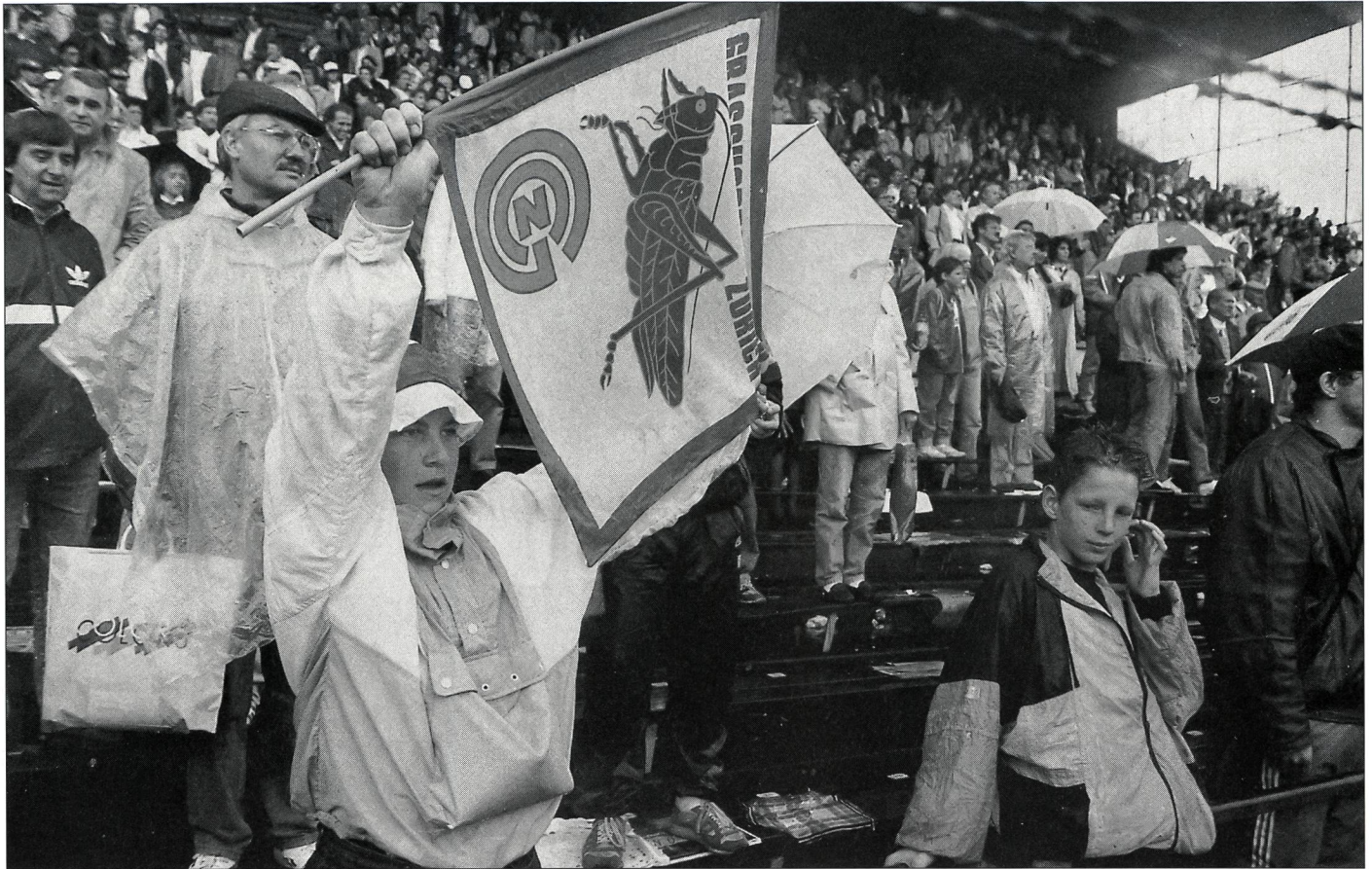
Friedliche Zuschauer: Ziel der entsprechenden Konvention.