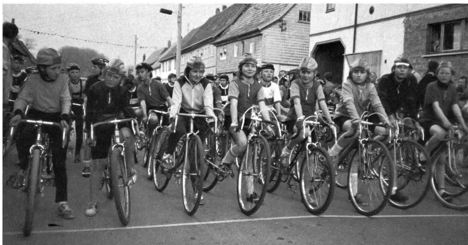
Start zur Bezirksmeisterschaft (Kriterium) der Altersklasse 11.

Die persönlichen Zwischendurchgespräche während des Lehrgangs mit anderen Trainern waren ergiebig und brachten Ideen und Vergleiche zu den eigenen Verhältnissen. Überhaupt spielte sich der gesamte Lehrgang in Bad Blankenburg in einer gelösten, lockeren Atmosphäre ab. Die Verantwortlichen der Sportschule und der Organisation begegneten uns mit herzlicher Gastfreundschaft. Obwohl mir dieser Lehrgang fachlich manche Bestätigungen, aber keine absoluten Neuheiten gebracht hat, habe ich in vielerlei Hinsicht profitieren können. Wenn der Radsportverband der DDR zusammen mit der FIAC die Auswahl der Teilnehmer künftig klar definiert und die Lehrgangsleitung die Anregungen aus diesem Symposium umsetzt, bin ich überzeugt, dass der IV. Internationale Radsportlehrgang von 1990 noch mehr an Qualität gewinnt. ■