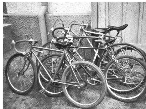
Vom Trainingszentrum zur Verfügung gestellte Velos für die Kinder. Die Ausstattung ist sehr bescheiden.

Anlässlich der Bezirksmeisterschaft kam man zwangsläufig mit den Jugendbetreuern ins Gespräch und konnte ausgiebigen Erfahrungsaustausch betreiben. Hier kamen die Widersprüche gegenüber den Vorträgen über die Jugendsportförderung in der DDR klar zum Vorschein. Einerseits wird von einer vielfältigen und ausgewogenen körperlichen und geistigen Ausbildung gesprochen, andererseits gilt es von seiten der TZ-Trainer Leistungen vorzuweisen, um überhaupt noch materielle Unterstützung für die jugendlichen Fahrer zu geniessen. Die Materialfrage ist seit längerem das grösste Problem im Radsport der DDR. Während dem die Repräsentanten der Elite mit Top-Material aus dem Westen versorgt werden, kämpfen die TZ-Verantwortlichen um jede Schraube! Sie sind deshalb gegenüber den eigenen Idolen eher kritisch eingestellt. Schlauchreifen, Schaltungen, Felgen, Kabel, Bremsgummi und diverses Kleinmaterial ist kaum oder nur über «Beziehungen» und Improvisationsvermögen erhältlich. So hat sich ein Zahntechniker die Polsterung für die Bremsgriffe (Handschutz) selbst aus Abgussmaterial hergestellt. Oder für fünf Schlauchreifen für das TZ nimmt man einen Weg von über 300 km in Kauf!