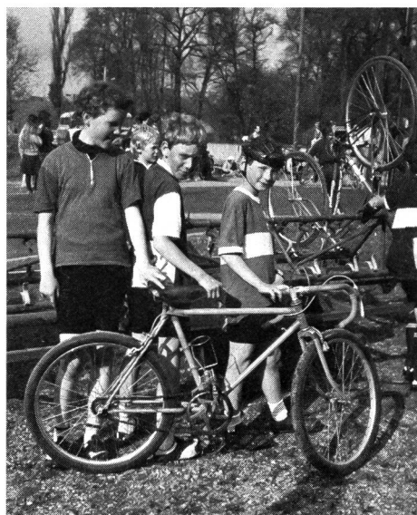
Stolz posieren die jugendlichen Fahrer nach dem Rennen vor der Kamera. Im Hintergrund ist ein selbstgefertigter Veloanhänger zu sehen, der 14 Rennvelos Platz bietet.