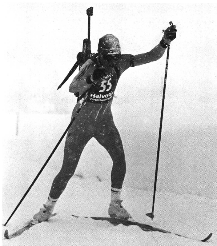
Die Skating-Technik ist im Triathlon erlaubt.

Die Tabellen stammen aus «1986 Suisse 1987 – Triathlon» einer Publikation des «Club Triathlon Suisse», Schosshaldenstrasse, 3000 Bern 32. Unten links: Nationalmannschaft 1986/87. Sie wird die Schweiz an der CISM-WM vom 2. bis 7. März 1987 in Autrans (F) vertreten.