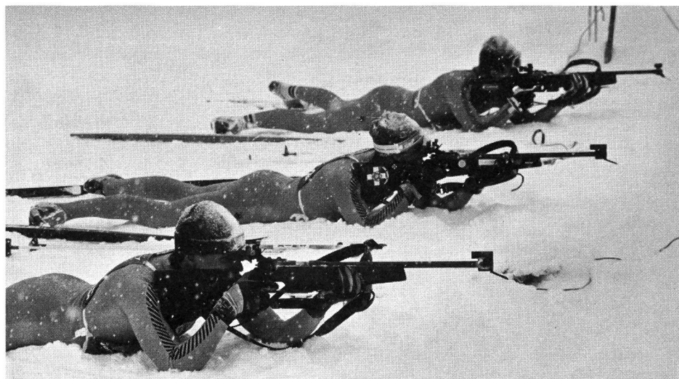
Neben liegend wird auch stehend geschossen.

(=Schweizerische Interessengemeinschaft für Militärischen Mehrkampf) und international dem CISM (=Conseil International du Sport Militaire) oder direkt der Armee, also der Sparte Militärsport zugeordnet. Bei den nationalen Wettkämpfen (SIMM) mit getrennten Disziplinen redet man aber eher vom Mehrkampf, vom Winter-Dreikampf.