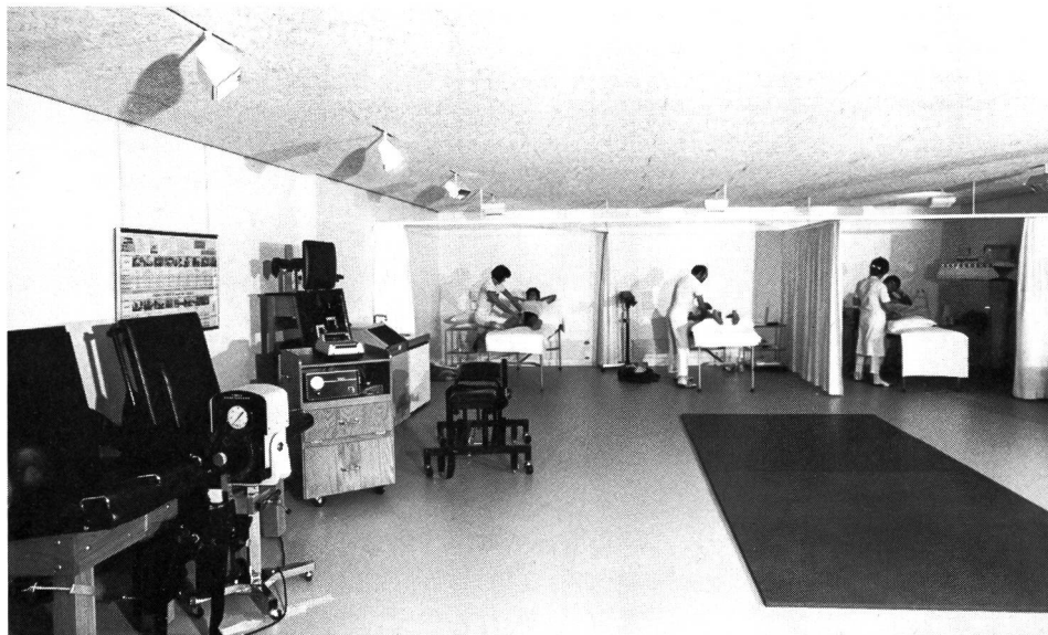
Die neue Physiotherapie des erweiterten Forschungsinstituts ETS.

Unser Bild (unten) zeigt die in den Anbau transferierte erweiterte Physiotherapie, wo das Dienstleistungsangebot zum Beispiel durch aktive Krankengymnastik, Fangopackungen und isokinetisches Krafttraining mit Hilfe des links auf dem Bild erkennbaren Cybex-Gerätes verbessert werden konnte. ■