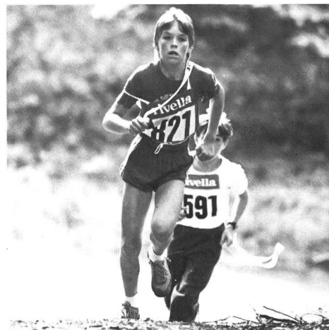
Cross als Ausdauerprüfung immer beliebter. Nahezu 12 000 Läuferinnen und Läufer mehr in- nert eines Jahres.