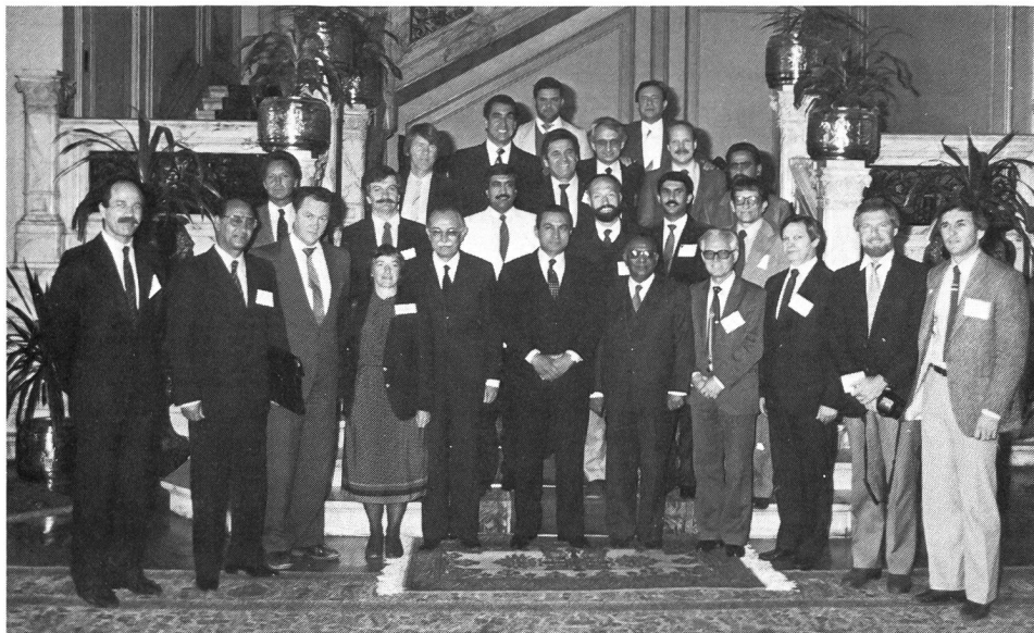
Das obligate Kongress-Gruppenbild mit Ministerpräsident Mubarak in der Mitte.

wie? Es wurde vorgeschlagen, eine Kommission zu bilden, die sich der Probleme des Sportes in den Medien annimmt. Kann eine Kommission diese Aufgabe zentral wahrnehmen? Müsste nicht jeder Sportfunktionär, jeder Journalist, jeder Reporter, aber auch jeder Lehrer, Professor und auch die Sportler selbst mithelfen, den Sport in den Medien richtig abzubilden? Und zwar jetzt, ohne auf die Entscheidung der Medienkommission zu warten. Nur wenn alle am Sport Interessierten mithelfen, erhält der Sport in den Medien rechtzeitig den richtigen Platz. Medien haben bestimmt eine Schlüsselfunktion bei der Entwicklung des Sportes für alle.