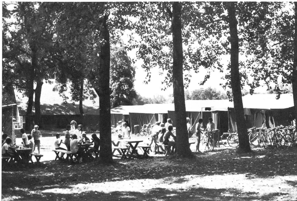
Das Zeltlager, Inbegriff von «Tenero» – auch in Zukunft.