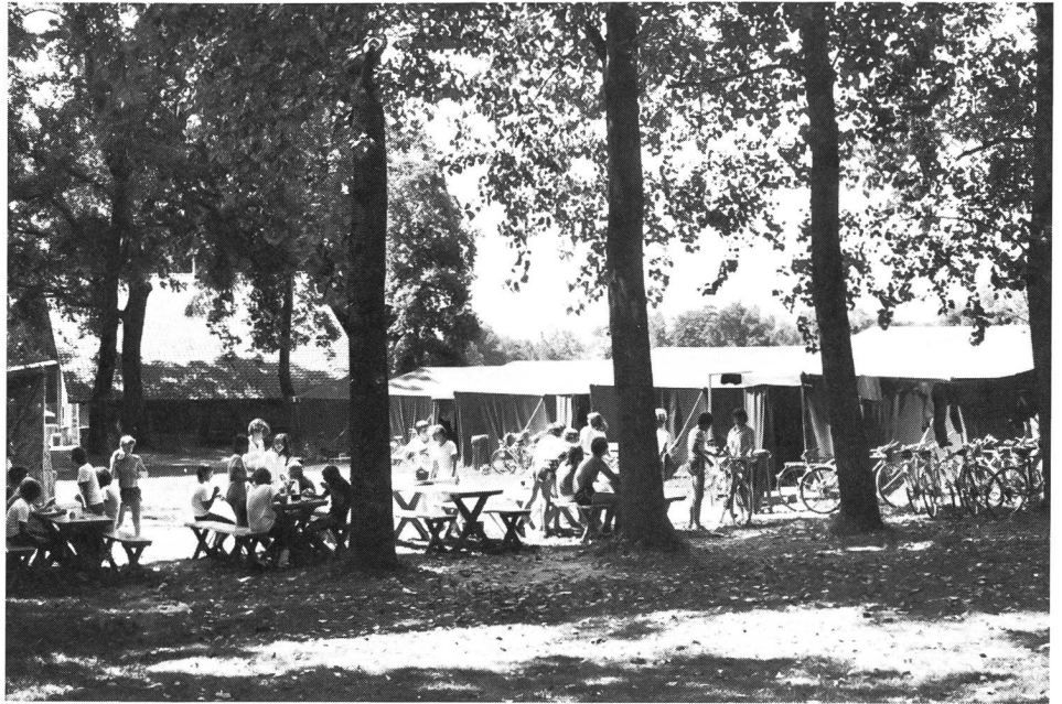
Das Zeltlager, Inbegriff von «Tenero» – auch in Zukunft.