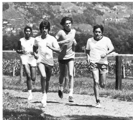
Die Finnenbahn – ein Ort der Begegnung.

Es ist eine Tatsache, dass sich die Gäste im Jugendsportzentrum in den letzten 25 Jahren verändert haben. In der Anfangszeit hatten wir Jugendliche zwischen 18 und 20 Jahren und speziell aus ländlichen Gegenden. Heute ist es ein Gemisch von Erwachsenen bis zu Kindern von 12 Jahren, die aus der ganzen Schweiz, von Stadt und Land kommen. Das Benehmen der Jugend im Lagerbetrieb ist anders geworden. Besonders bei den Jüngsten stellen wir fest, dass sie freier und gewandter miteinander umgehen und auch gegenüber den Lagerleitern offener sind. Das ist wohl auf die weniger strenge Erziehung zu Hause zurückzuführen und hat in den mitmenschlichen Beziehungen viel Positives gebracht. Trotz vermehrter Belegung im Haus und auf dem Zeltplatz haben sich negative Zwischenfälle nicht vermehrt. Es freut uns festzustellen, dass wohl der Lärmpegel gestiegen, aber die Disziplin gut ist. Durch die Einführung von J+S kamen sofort vermehrt gemischte Kurse. Anfängliche Bedenken betreffend Verhalten zwischen Buben und Mädchen haben sich mit wenigen Ausnahmen nicht bewahrheitet. Im Gegenteil, Mädchen und Buben motivieren sich gegenseitig, was sich auf die Leistungen im Sport und auf den Lagergeist positiv auswirkt.