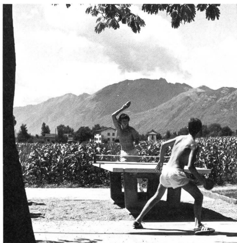
Spielmöglichkeiten in der Freizeit unmittelbar beim Unterkunftsgebäude, dem ehemaligen Soldatenheim.

Jeder Kursleiter stellt kurz diejenigen Programmteile vor, die mit den anderen Kursen Friktionen geben könnten. Anschliessend wird der «Schönwetterfall» koordiniert. Soweit es gewünscht wird oder eine Koordination notwendig ist, wird die Benützung der Anlagen über die ganze Kursdauer festgelegt. Im gemeinsamen Gespräch können oder müssen oft gewisse Vorstellungen der Benützer subtil geändert werden.