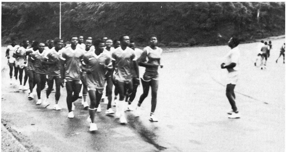
Sport in Kamerun: Noch halb in der Dämmerung morgens um 5 sind die «Jogger» unterwegs: Militär, Schulen, Sportclubs. Es wimmelt von Sportbegeisterten. Eine Stunde später ist die Backofenhitze bereits da.

Dass die Förderung von Landwirtschaft, Basisgesundheitsdiensten und Alphabetisierung zu einer an den Grundbedürfnissen orientierten Entwicklungspolitik gehört – wer könnte das bestreiten? Gehört auch die Sport-Entwicklungshilfe dazu? Das Problem ist international nicht gerade brandneu, wird doch schon längst ein bestimmter Prozentsatz der TV-Einnahmen aus den Olympischen Spielen für die «Solidarité Olympique» abgezweigt. Die Unesco verfügt über den Sportförderungsfonds Fideps. Die Firmen Adidas und Coca Cola leisten Sporthilfe, vorab über die FIFA. Auch einzelne Staaten haben eine Sport-Entwicklungshilfe aufgebaut, darunter die Bundesrepublik Deutschland: 1983 hatte sie dafür 104 Mitarbeiter im Einsatz, insgesamt flossen 55 Mio. Mark in diesen Bereich. Jetzt wird diese Frage womöglich auch in der Schweiz aktuell: Durch die Absicht, einen Teil des Erlöses aus der neuen Sporthilfe-Sondermarke für Entwicklungshilfe auszugeben. Doch – was ist Sport-Entwicklungshilfe? Die Antwort hängt vor allem davon ab, was unter «Sport» verstanden wird.