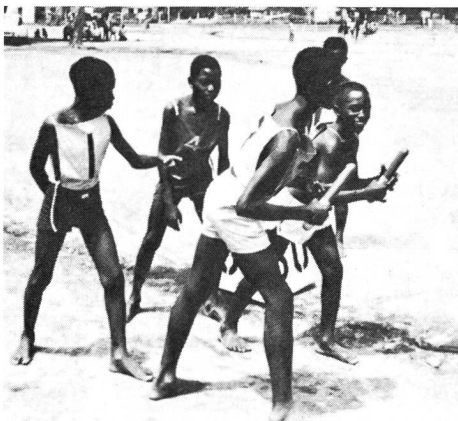
Schüler-Stafette in Afrika (Repro aus dem Buch «Sport facile»).

Anders ausgedrückt: Im aktiven wie im passiven Sport gewöhnen sich die Menschen an Regeln, die im Sport ebenso gelten wie für das gesellschaftliche Leben überhaupt. Vor allem junge Menschen könnten im positiven Fall den Duft einer erwünschten neuen Welt erfahren, wo nicht ständig der Arme unterlegen ist, wo Gleichheit herrscht und Fairplay. Der Sport erzieht: Er kann ein ideales Übungsfeld sein, um mit Menschen von anderer Rasse und Klasse, Kultur und Überzeugung auszukommen. Sportwissenschaftler stellten fest: Sport kann das Leben und Zusammenleben mitformen – auch in Entwicklungsländern. Denn im Sport lernt man sich ein Ziel setzen. Mit andern zusammenspielen. Regeln und Gesetze, Fairness und gerechte Bedingungen beachten. Das ist in Entwicklungsländern nicht unwichtig.