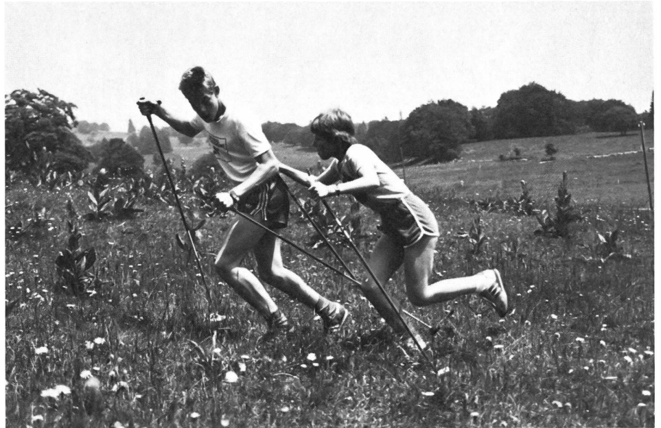
«Einfuchsen» der Staffelübergabe.

Die Strecken für Stocksprünge müssen kürzer gewählt werden. Für Jugendliche sind schon 200 m recht nahrhaft, auch wenn richtigerweise die Belastung im aeroben Bereich gehalten wird. Mit Läufern im JO-Alter (10 bis 15 Jahre) habe ich jeweils