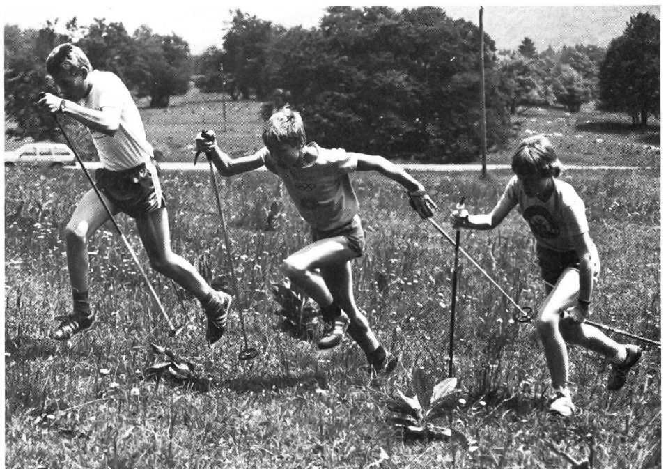
Wer erkennt die technischen Unterschiede und Mängel?

Im Gegensatz zum Skigang liegt hier im Bewegungsablauf die Betonung beim letzten, explosiven Abstoss. Auch werden die Füße mehr vom Boden abgehoben. Dies darf allerdings nicht zu übertriebener Betonung der Vertikalkomponente verleiten; die Bewegung soll vorwärts gerichtet sein. Im methodischen Aufbau kann auch diese Form ohne Stöcke geübt werden. Sobald aber die Beinarbeit «sitzt», gehören die Stöcke unbedingt dazu. Für die Armhaltung gelten die gleichen Grundsätze wie im Schneetraining. Das bedingt natürlich einen Untergrund, der den Stockspitzen gute Griffmöglichkeiten bietet. Asphaltstrassen sind schon aus dieser Sicht ungeeignet.