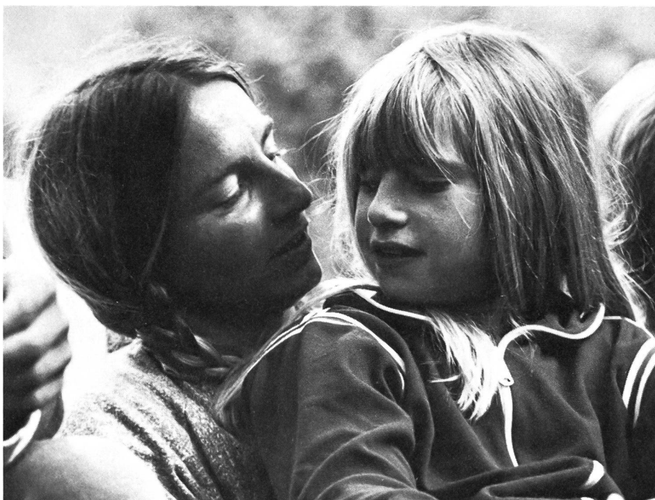
Innige Zwiesprache Mutter-Kind, auch ohne viele Worte.

Ein Gespräch, ein Dialog entsteht zwischen dem Ich und dem Du und nicht unter Gruppen.