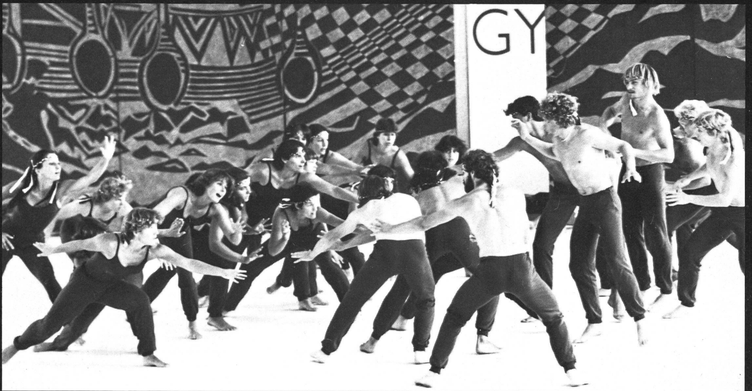
ETS Magglingen (C. Gilardi)