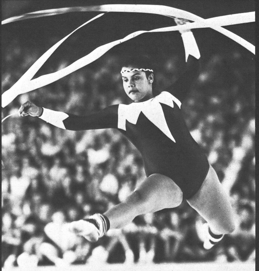
Fluminense Football-Club, Brasilien