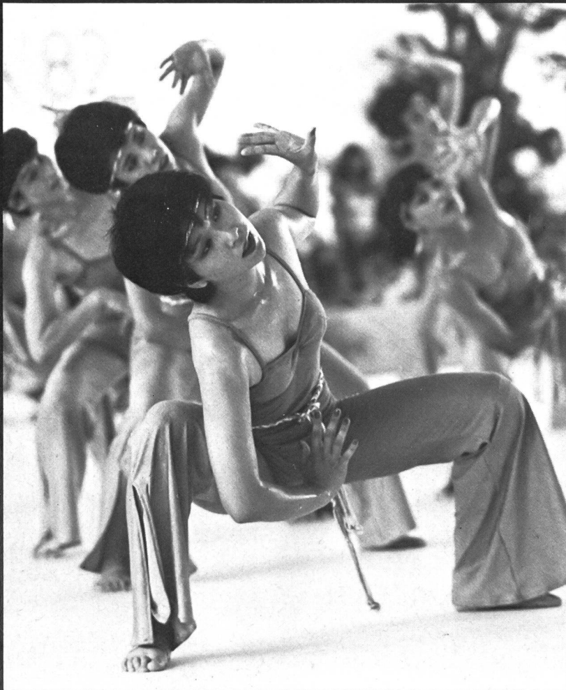
Japan Gymnastic Association (Sato Makaso)