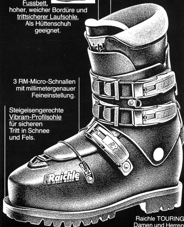
Raichle TOURING Damen und Herren Fr. 290.-

Steigeisengerechte Vibram-Profilsohle für sicheren Tritt in Schnee und Fels.