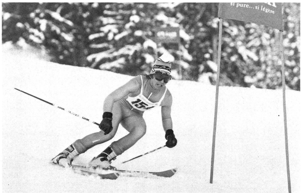
Eine der 3 Triathlon-Disziplinen, der Riesenslalom

Wer noch zu jung ist, um einen der alljährlich in der ganzen Schweiz durchgeführten Jungschützenkurse zu besuchen, besorgt sich ein Luftgewehr und schiesst im Keller auf eine selbstgebastelte Scheibe mit Kugelfang (Vorsichtsmassnahmen beachten!). Für Junioren empfiehlt es sich, einen Jungschützenkurs zu besuchen und das Training im Schützenverein unter kundiger Leitung fortzusetzen. Ältere Teilnehmer, die die RS besucht haben, benützen für das persönliche Training die Ordonnanzwaffe. Jeder hat seine persönlichen Schwächen (er-