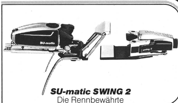
SU-matic SWING 2 Die Rennbewährte