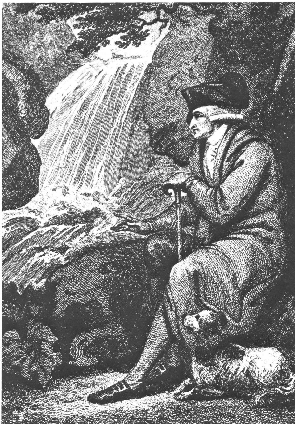
Rousseau entdeckt die landschaftliche Schönheit der Natur. Englischer Stich des 18. Jahrhunderts.

se formulierte Wahrheiten und Weisheiten. Stellen, die uns zum Nachdenken anregen, als Warnung hingenommen werden können.