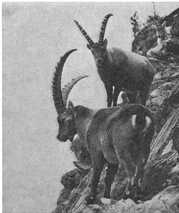
Steinböcke sind hervorragende Kletterer.

Ueber den Schweizer Nationalpark im Engadin zu berichten, hiesse, Eulen nach Athen zu tragen. Naturbegeisterte Menschen aus aller Welt haben ihn durchwandert, erlebt. Aber nicht alle wissen die ungezählten kleinen und grossen Wunder, denen man auf Schritt und Tritt im Nationalpark begegnet, zu deuten. Deshalb werden geführte Nationalpark-Wanderungen veranstaltet. Kommenden Sommer im Rahmen einer regional koordinierten Gemeinschaftsaktion der Verkehrsvereine rund um den Nationalpark.