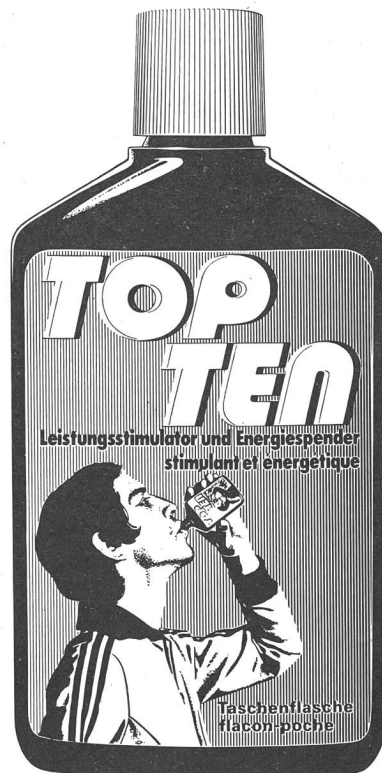
Abbildung/Figure 3 Originalpackung von Top-Ten. Emballage original du Top-Ten.

et sera vendu dans les magasins spécialisés (fig. 3). * Top-Ten sera livré, prêt à la consommation, dans des flacons incassables avec bouchon dévissable que l'on peut facilement emmener avec soi, même en tenue de sport très légère. Un flacon de 150 ml de liquide contient 90 g d'hydrates de carbone de haute