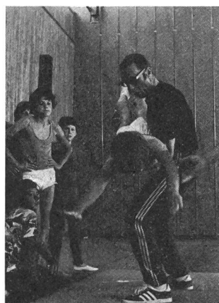
Transfer von der Vor-

Die Berücksichtigung dieser unterschiedlichen Voraussetzungen ist für die Wahl des methodischen Weges von grosser Bedeutung und steht in einem sehr engen Zusammenhang mit Fragen der Begünstigung von Lernübertragungen vertikaler und lateraler Art.