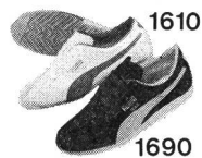
1610 Vita-Parcours Fr. 49.— weisser Rindbox, Sägeprofilsohle