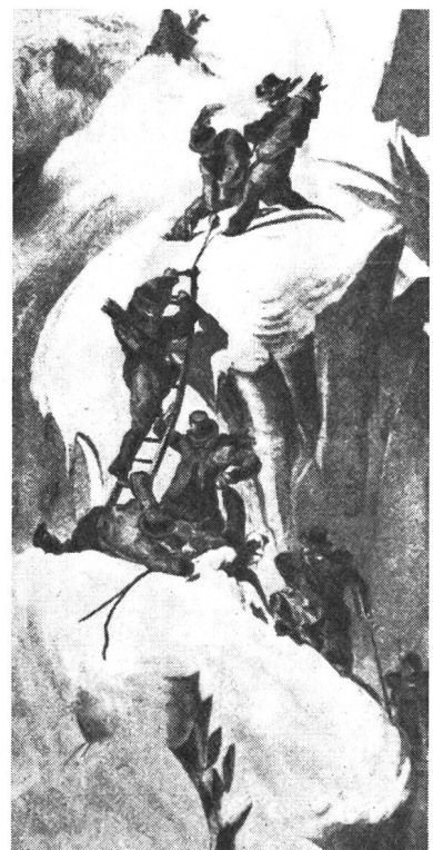
So bezwang man Anno 1853 schwere Passagen. Auch für solche Abenteuer trennte man sich nicht von Zylinderhut und Frack.

Diese verworrenen Vorstellungen dürften den einen Grund dazu ergeben haben, warum die Kindertage des Alpinismus noch gar nicht so schrecklich weit zurückliegen, der andere darf wohl in der Unerschlossenheit der Gebirgsgegenden gesehen werden. Bahnen gab es natürlich keine, befahrbare Wege nur wenige. Routenmarkierungen und genaue Karten waren unbekannt.