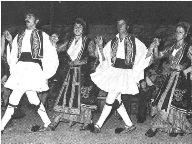
Griechische Tänzerinnen und Tänzer

Dreimal steht auf dem Programm «social evening»: Gemeinschaftsabend. Alle treffen sich nach dem Nachtessen auf dem Vorplatz des Theatersaales, wo in einem grossen Halbkreis Stühle bereitgestellt sind. Der Auftakt wird durch einen Gemeinschaftssong gegeben, dann geht es weiter mit folkloristischen Tänzen aus verschiedenen Ländern, mit humoristischen Stücken, mit Gesang, Spiel und Jodel. Einen besonderen Anklang findet die griechische Tanzgruppe mit ihren wundervollen Kostümen und ihrer besonderen Begabung für Rhythmus und Ausdruck (siehe Photo).