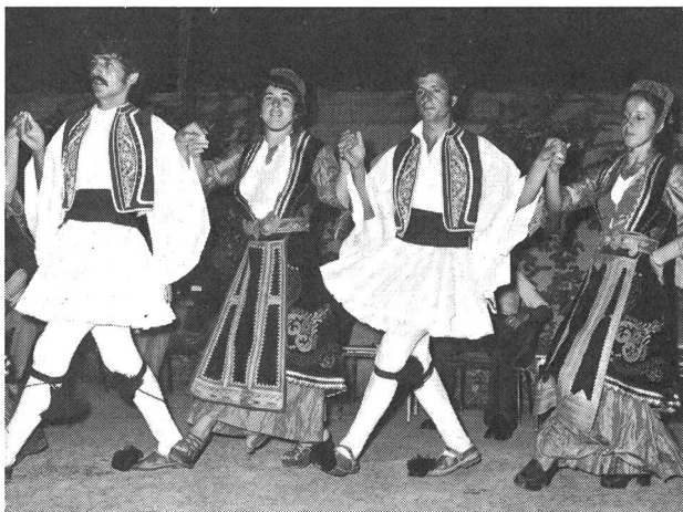
Griechische Tänzerinnen und Tänzer

Dreimal steht auf dem Programm «social evening»: Gemeinschaftsabend. Alle treffen sich nach dem Nachtessen auf dem Vorplatz des Theoriesaales, wo in einem grossen Halbkreis Stühle bereitgestellt sind. Der Auftakt wird durch einen Gemeinschaftssong gegeben, dann geht es weiter mit folkloristischen Tänzen aus verschiedenen Ländern, mit humoristischen Stücken, mit Gesang, Spiel und Jodel. Einen besonderen Anklang findet die griechische Tanzgruppe mit ihren wundervollen Kostümen und ihrer besonderen Begabung für Rhythmus und Ausdruck (siehe Photo).