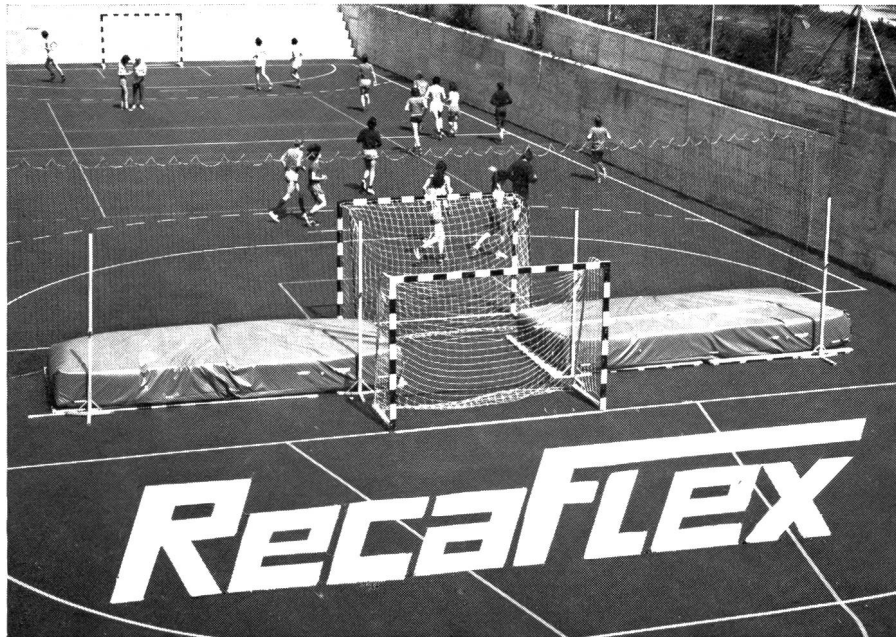
Recaflex: Spitzenbelag für Mehrzweck-, Spiel- und Sportanlagen (Kunststoffgebundenes Material auf Polyurethan-Basis)