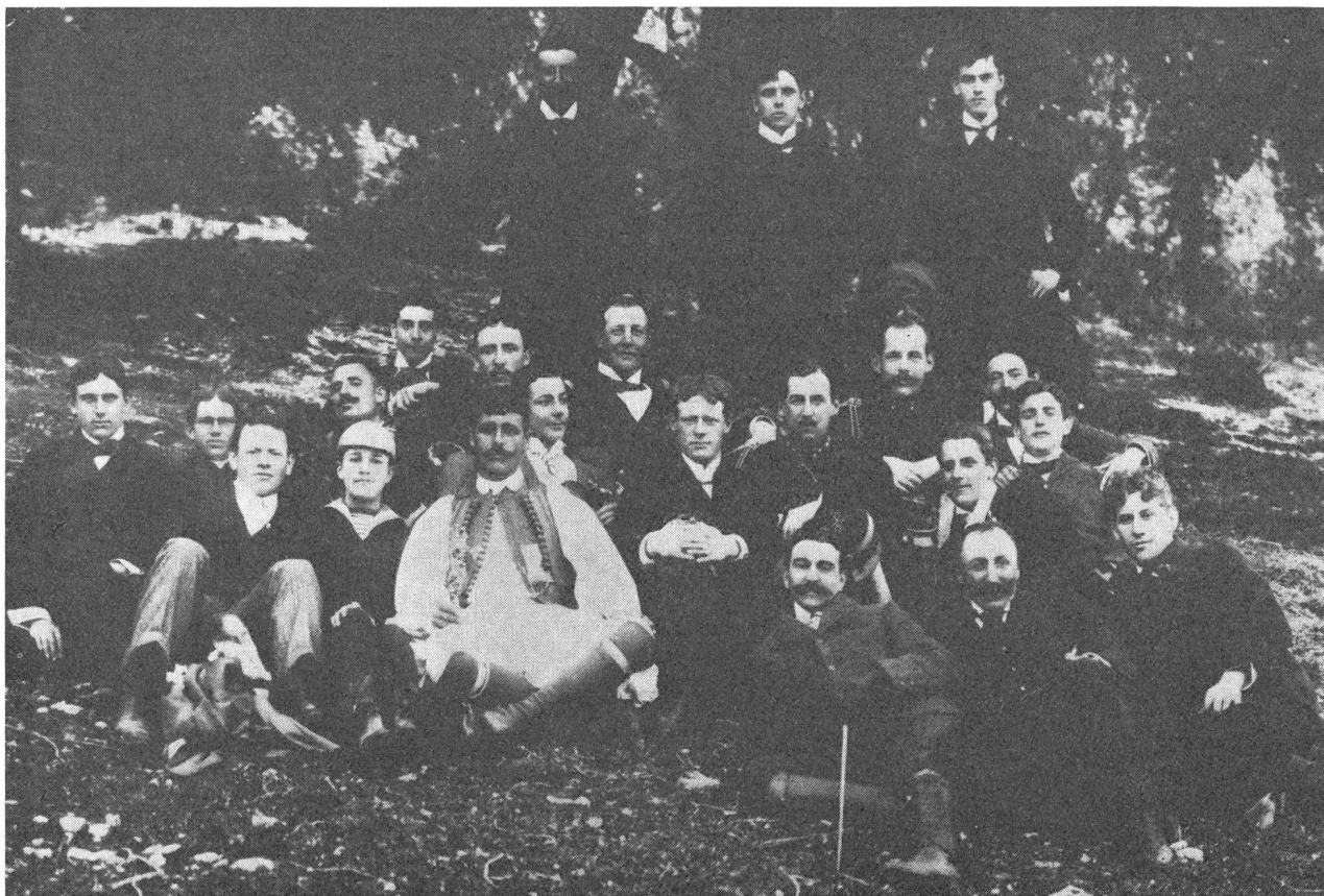
Erste olympische Spiele Athen 1896: In der ersten Reihe im griechischen Nationalkostüm der Gewinner des Marathonlaufes Spyros Louis und andere Gewinner. Letzter rechts in Uniform, Prinz Konstantin, Herzog von Sparta, Präsident des griechischen Olympischen Komitees und die Prinzen Georges und Nikolaus, Mitglieder des Olympischen Komitees. Im Vordergrund (dritter von rechts) Coubertin.

Nur aus 13 Nationen meldeten sich Wettkämpfer. Die nächste olympische Veranstaltung im Jahre 1900 lag zu sehr im Schatten der Pariser Weltausstellung, als dass sie hätte weltbewegend werden können, und mit den Spielen von 1904 in St. Louis (Vereinigte Staaten) ging es nicht viel besser. 1906 — zum zehnjährigen Jubiläum der Wiedereinführung — gab es in Athen Zwischenspiele, bei denen Kronprinz Konstantin von Griechenland als Zeitnehmer und Schiedsrichter amtierte. Erst die Spiele von 1908 in London, wiederum mit einer Ausstellung verquickt, begannen Coubertins Ideen langsam zum Sieg zu verhelfen: Weltgeltung brachte jedoch erst Stockholm im Jahre 1912 in einem neubauten Stadion. Jetzt begann nach langem mühevollen Kampf das zu reifen, was dem Begründer der Olympischen Spiele eine Herzenssache gewesen war.