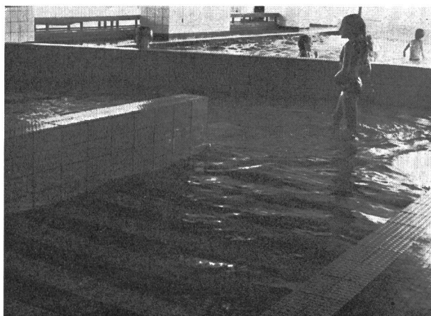
Neben dem normalen Hallenbecken befindet sich noch eine Lehrschwimmanlage. Im Vordergrund die Rampe, auf der Invalide mit den Rollstühlen ins Wasser fahren können.

Gleich neben dem Hallenbau liegt der Ausgangspunkt der Fitnessbahn, eine Anzahl von Lauf- und Wanderwegen sowie eine beleuchtete Langlaufloipe. In einem coupierten Gelände stösst man nach einem zweiminütigen Lauf zu einer Sporthütte, in der sich die Benutzer dieser Aussenanlagen umziehen, duschen, verpflegen, und im Winter die Ski wachsen können. Keine 50 m neben der Sporthütte steht der schlanke Holzturm der Sprungschanze. Der Sprungturm erhebt sich am Rand einer Geländerinne, deren Abhänge auch für Slalomtraining verwendet werden können. Den Slalomfahrern steht sogar ein kleiner Schlepplift zur Verfügung.