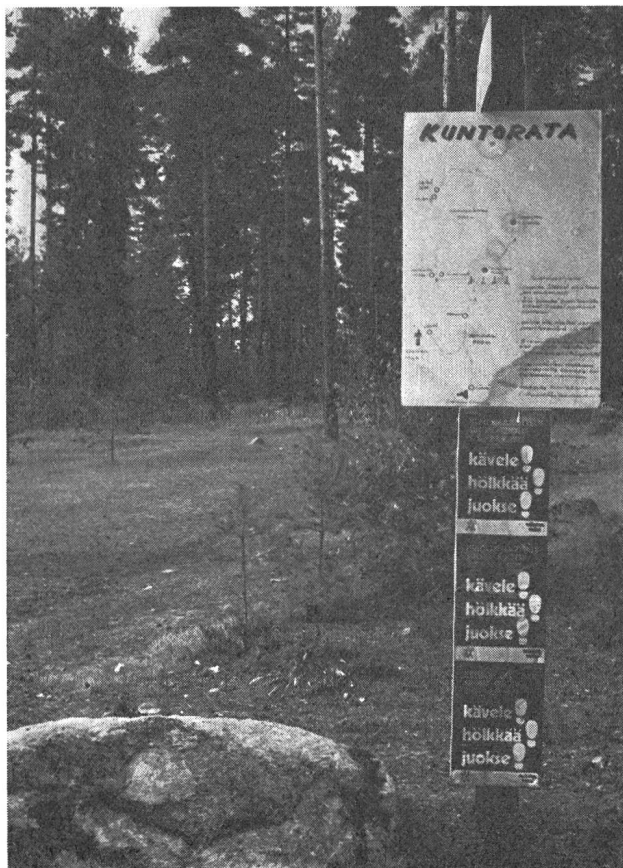
Startplatz mit Orientierungstafel für den Fitness-Parcours.

angestellten Sportlehrer geleitet. Die Trainierschule wird besonders von Männern geschätzt, die Tag für Tag im harten Berufsleben stehen.