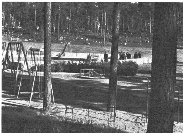
Kinderspielplatz und Planschbecken.

Die Gesamtkosten dieser Anlage betrugen rund 4,5 Millionen Schweizer Franken.