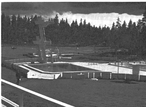
Heizbares Freibad (50 x 16,67 m) mit Sprungturm und separatem Becken. Im Hintergrund die grossen Spiel- und Liegewiesen.

Die umfassende Reichskampagne zur Förderung und Verbesserung der Gesundheit und Leistungsfähigkeit der finnischen Bevölkerung hat die Stadtväter dieser Stadt veranlasst, dazu die notwendigen Anlagen und Einrichtungen zu erstellen.