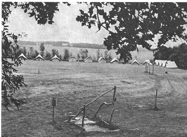
Campingplatz. Im Vordergrund einige Anlagen des Fitnessparcours. Im Hintergrund Unterakunfts- und Verpflegungsgebäude.