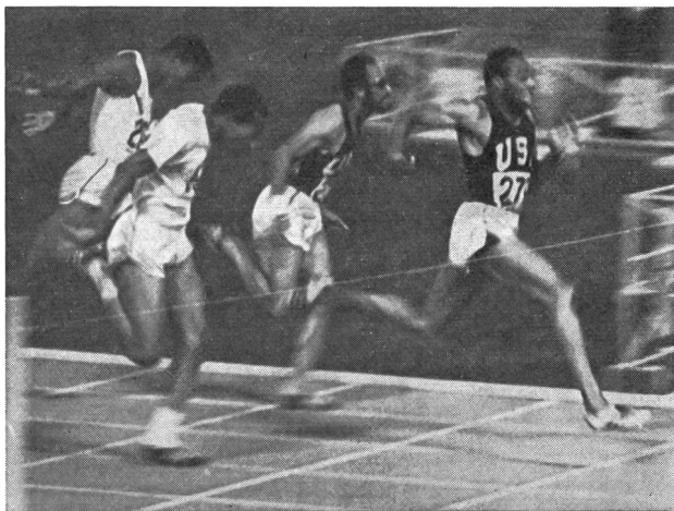
Lauter Schwarze im 100-m-Weltrekord-Endlauf. Jim Hines siegt mit 9,9 (Weltrekord egalisiert) vor Lennox Miller (Jamaika) und seinem Landsmann Charlie Green.