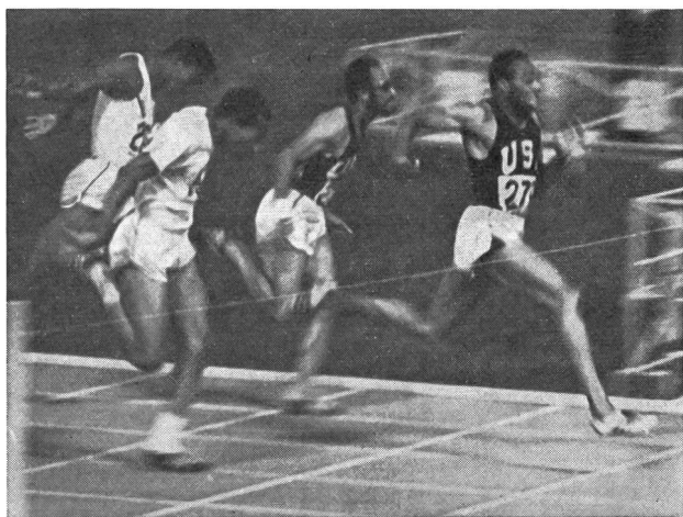
Lauter Schwarze im 100-m-Weltrekord-Endlauf. Jim Hines siegt mit 9,9 (Weltrekord egalisiert) vor Lennox Miller (Jamaika) und seinem Landsmann Charlie Green.