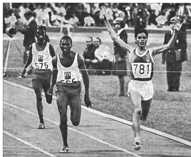
Der Tunesier Gammoudi siegt im dramatischen 5000-m-Lauf vor Keino und Temu (Kenia).