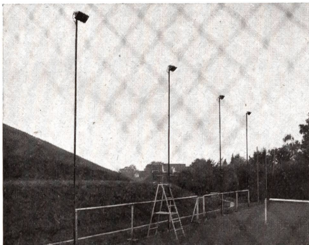
Spezialkonstruktion bei seitlichen Gittern unter 4 m Höhe.

Beleuchteter Doppelplatz. Seitliche Anordnung der Spezialscheinwerfer mit Ausblendungslamellen erlauben ein angenehmes Spielen. Gezieltes Licht nur auf die Spielfläche, dadurch maximale Ausnützung der Lichtquellen.