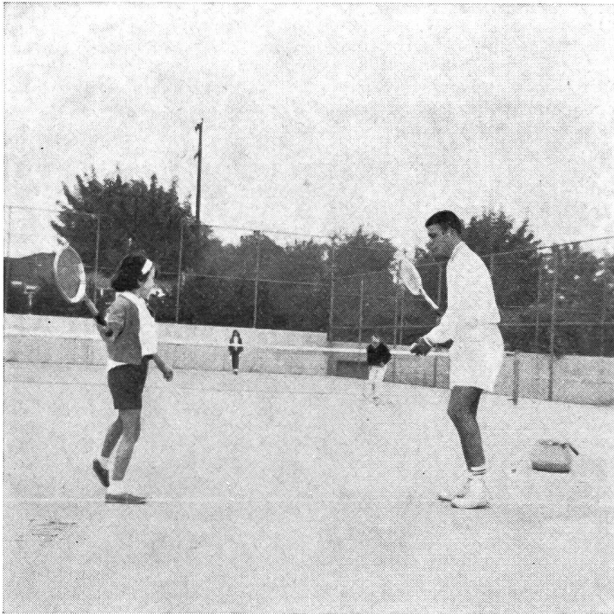
Der Lehrer zeigt die korrekte Beinarbeit mit Gewichtsverlagerung.

Ein vom Klub angestellter Tennislehrer erteilt der Fortgeschrittenengruppe gegen eine Gebühr einen jeweils zwanzig Minuten dauernden Unterricht zur För-