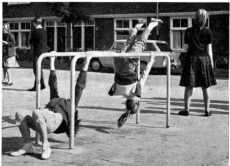
Der Kleinbarren, einfach und robust

Mit den Kleinturngeräten wird beabsichtigt, den Schülern in den Pausen, vor und nach den Schulstunden Geräte in die «Hand» zu geben, an denen sie ihren natürlichen, grossen Bewegungsdrang ausleben und ihre Geschicklichkeit erproben können. Die überschüssigen Kräfte sollen in richtige Bahnen gelenkt werden, also dort zur Anwendung gelangen, wo es am Platze ist. Das Ruhigsitzen im Schulzimmer wird dem Kinde weniger Mühe bereiten, wenn auch der Bewegungsdrang gestillt werden kann. Die «mittleren und älteren Jahrgänge» unter den Lesern erinnern sich sicher noch gut an ein beliebtes, heute leider verschwundenes Turngerät. Es stand seinerzeit vor den Wirtschaften und