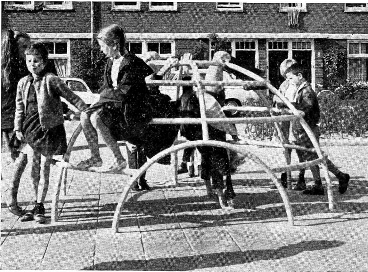
Die Kletterkuppel ist sehr beliebt

Gasthöfen, bestand aus einer Stange auf Pfosten und diente zum Anbinden der Pferdefuhrwerke. Daneben wurde es von den Kindern aber auch eifrig als Turngerät benützt. Das Gesicht dieses Abstellplatzes hat sich in den Jahren grundlegend verändert, es ist daraus ein Motorfahrzeug-Parkplatz geworden, auf dem Kinder nichts mehr zu suchen haben.