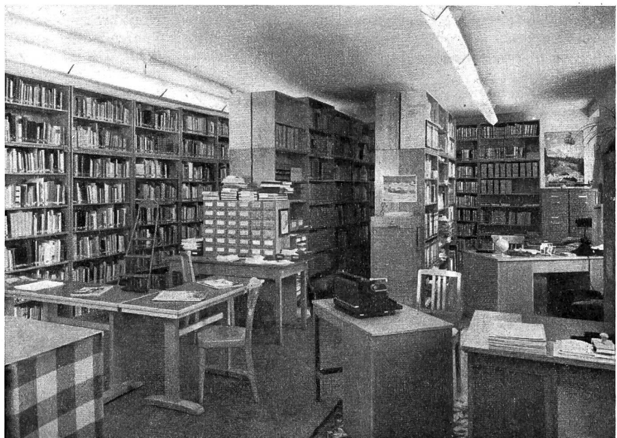
Ansicht einer provisorischen Anlage der Bibliothek der ETS Magglingen.

Der Katalog ist der Schlüssel zu den Schätzen einer Büchersammlung! Wer die Kataloge kennen lernt, wird viele Entdeckungen machen.