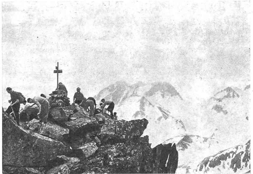
Der letzte Wegweiser weist heimwärts.

Die Durchführung des Gebirgs-Leiterkurses 1959 als Wanderkurs war als Experiment gedacht, wobei wir uns bewusst waren, dass dieser Vor- und Nachteile aufdecken werde.