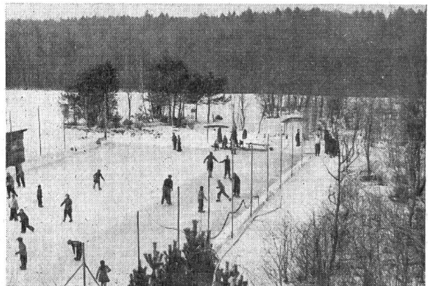
Im Winter dient der Tennisplatz als Eisbahn.