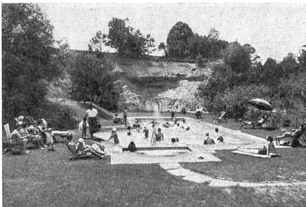
Regel Betrieb im Schwimmbad.

Der Betriebsleiter erklärte mir, dass der Zusammenhang innerhalb der Belegschaft durch die gemeinsame freiwillige Arbeit, die sich über einige Jahre erstreckte, bedeutend besser geworden sei. Die Freizeit (im Schichtbetrieb besonders schwierig zu gestalten) stelle lange kein solch schwieriges Problem mehr dar wie früher, haben doch die Leute für ihren körperlichen Bewegungsdrang ein natürliches Ventil gefunden. (Da die Belegschaft und ihre Angehörigen auch in kultureller Hinsicht etwas abgelegen sind, versucht die Betriebsleitung durch Vorträge, Filmvorführungen sowie durch Musik- und Gesangsveranstaltungen auch die geistig-seelische Seite zu pflegen.) Die Beweggründe der Betriebsleitung zum Bau der Sportanlage waren: